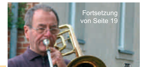
Fortsetzung von Seite 19